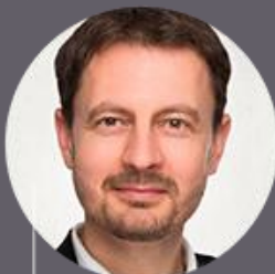
EDUARD HEGER OLaNO