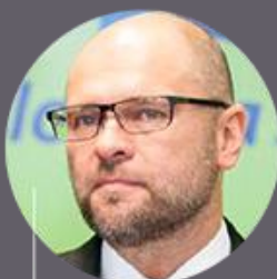
RICHARD SULÍK SaS